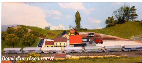
Détail d'un réseau en N

Quelques exemples de réalisations montrent la qualité des modèles exposés :