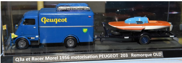
En particulier, les réalisations de Jean-Paul sous la forme de plateaux complets sont très pratiques