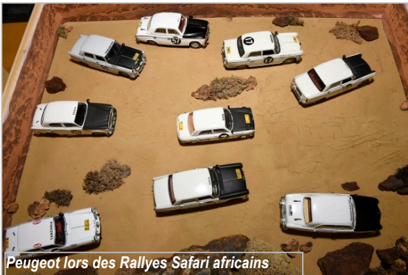
pour ce type d'exposition (Peugeot lors des Rallyes Safari africains, Evolution du système Eclipse, Histoire des Peugeot 908 HDI, etc).