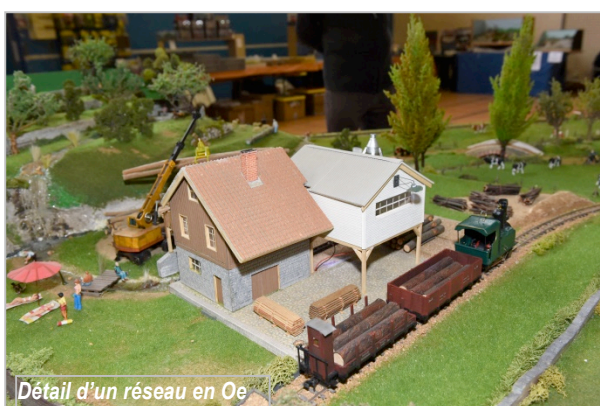
Détail d'un réseau en Oe