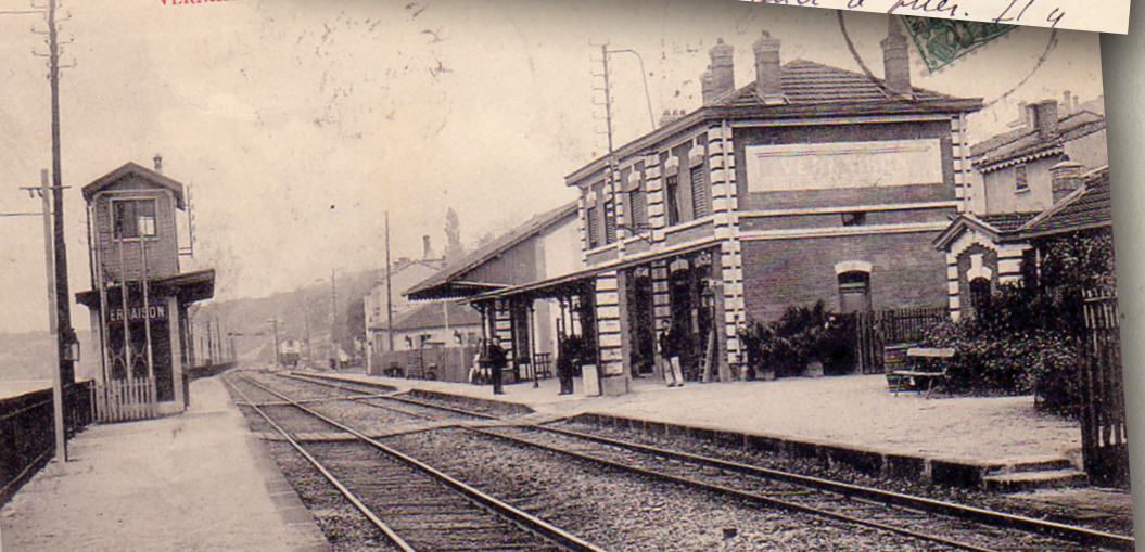
VERNAISON. - La Gare

maque une machine pour forger - a bon. Meilleur amitiés à tous. Tembran Leopold